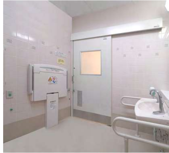
在無障礙廁所中使用案例